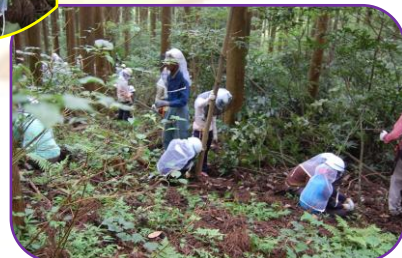
リポートレッキング