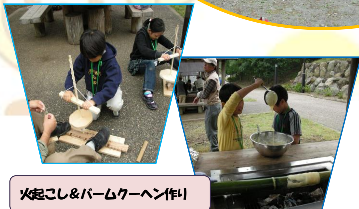
火起こし&パームクーヘン作り