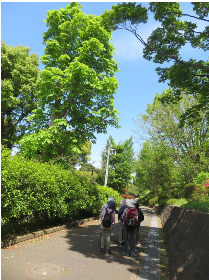
トチノキの観察(横浜市児童遊園地)