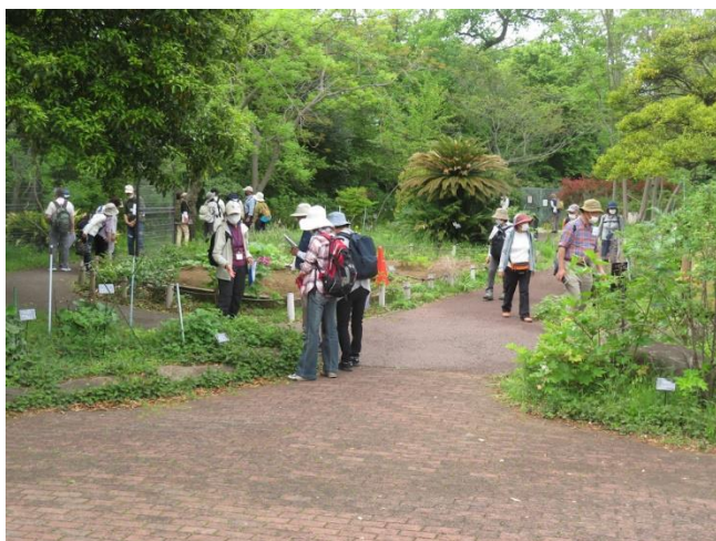
花木園で植物観察の様子（横浜市こども植物園）