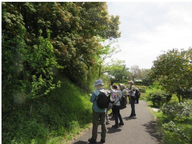
カナメモチの観察（横浜市児童遊園地）