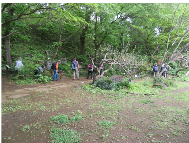
野草園でスプリング・エフェメラルの観察 （横浜市こども植物園）