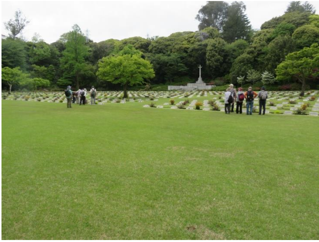
英連邦戰死者墓地